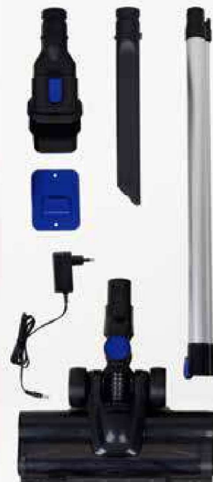
Accesorios incluidos Accessories included